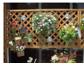
ハンギング部門 金賞作品