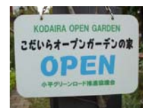
こだいらオープンガーデン 表示板