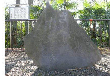
「さくら折るべからず」と刻まれた桜樹接樹碑 1851年建立