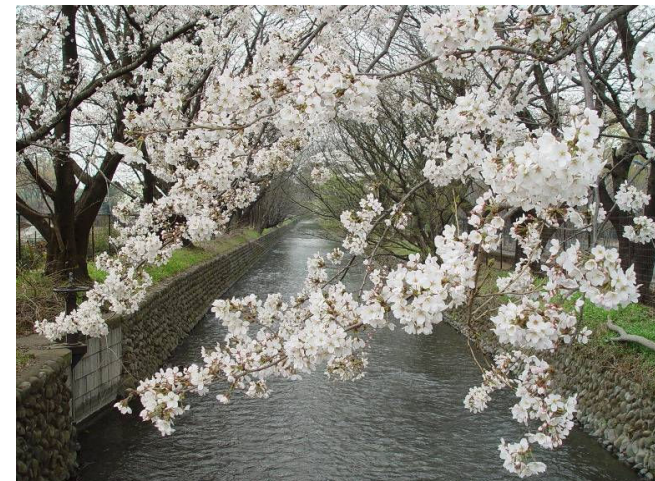
見影橋から上流方向・左(右岸)に源五右衛門分水口跡が見える