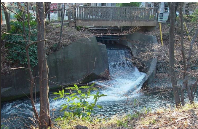
補給口より約2キロ先の多摩川の昭和用水堰・水門