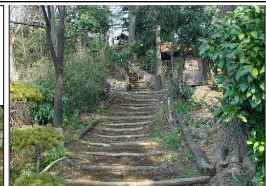
玉川上水を掘った土で築かれたとも言われる金比羅山