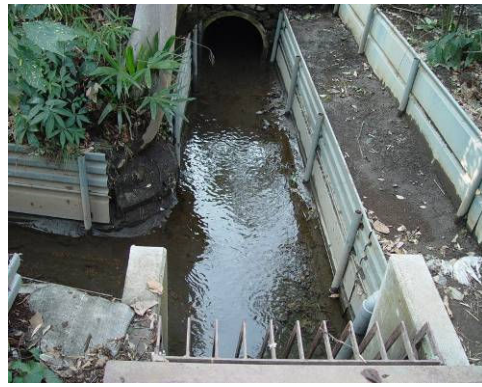
④ 小川用水南北水路合流地(上・北側 左・南側) 天神町交差点北西