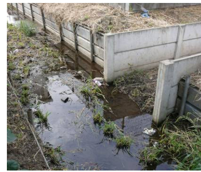
⑩ 野中用水南北分岐(手前・南流 右・北 流) 花小金井消防署東