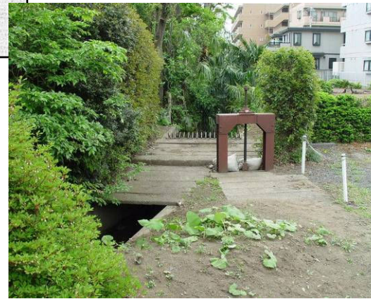
⑤ 喜平町分岐水門(左・新堀用水 右・鈴木用水) 喜平町警察学校宿舍南側町駐車場内。鈴木・大沼田用水は ここから暗渠となり団地東へ。巻上機は片側のみ設置さ れている(1973年施工)