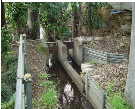
⑦ 天神町分岐水門(手前・野中 右・大 沼田用水) 天神町1丁目・天神町バス停南