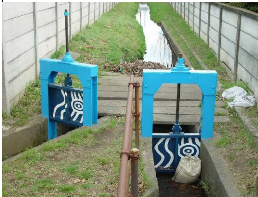
③ 小川用水南北分岐水門(左・南側 右・北側流路) 小川一番バス停南。巻上機は1970年施工