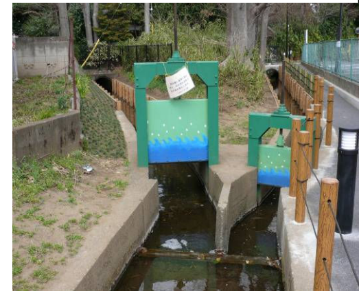
⑥ 回田町分岐水門(左・大沼田 右・鈴木用水) 小平団地東交差点 巻上機は1973年施工