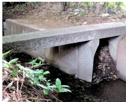
⑧ 田無水分岐口(左・田無用水 右・関野用水) 喜平橋東 「大正12年11月成」と彫られる。