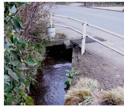
⑨ 鈴木用水南北分岐(手前・南流 右・北流 (道路下) 鈴木町寿院東南・共済住宅バス停前