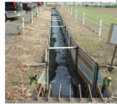
⑪ 大沼田用水流末(手前・暗渠排水路) 東京街道七小八入口交差点北