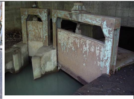
② 小川用水分岐水門(左・小川用水 右・新堀用水) 小川橋上流側橋下。巻上機は1960年施工