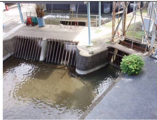
① 小平監視所内の新堀用水取水口 (左・上水本流芥止め 右側・新堀用水取水口)