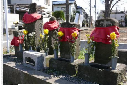
回田中道り入口の石塔・石仏